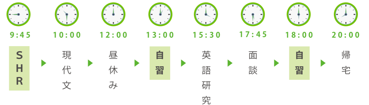
1日のスケジュール（後期モデル）

正しい生活のリズムをキープするためにSHR（ショートホームルーム）を設定しています。睡眠時間をしっかりとった上で、授業と自習に励みましょう！