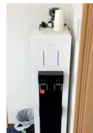
ウォーターサーバー